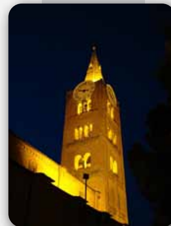
S.Maurizio bell tower.

Il centro di Pinerolo (40.000 abitanti) è facilmente raggiungibile per appagare qualsiasi esperienza gastronomica ed esigenza di shopping .